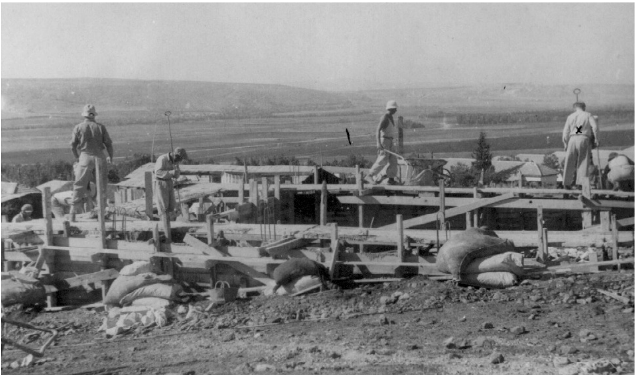
הנחת היסודות לבניין קבע, משכן לאמנות עין חרוד, 1947

אתר הטיל על עצמו חובה של שליח ציבור – לדאוג לעיצובו האסתטי ולתוכנו הרוחני של ביתו הקיבוצי. בשנות ה־30 וה־40 יצר