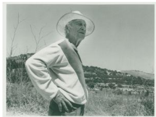
יוסף זריצקי ב-1981 אברהם חי

קצת יותר מחודשיים אחרי הפרישה המרעישה מאגודת האמנים, ב-2 ביולי 1948, כבר פירסמה הקבוצה החדשה גילוי דעת בעיתון "הארץ", בו הסבירה מדוע חבריה אינם משתתפים בתערוכה הכללית של אמני ארץ ישראל. היתה זו התערוכה הראשונה שאורגנה לאחר קום המדינה, והיא נפתחה ערב קודם בבית האמנים החדש ברחוב אלחריזי בתל אביב בנוכחות שרי ממשלה, שגרירים ואנשי צבא. הפורשים טענו שהתערוכה לא הולמת לדעתם את "רמת הציור הטוב בארץ". במקום זאת, אירגנו תערוכה משלהם, שנפתחה ב-9 בנובמבר 1948 במוזיאון תל אביב ונקראה "אופקים חדשים". מנהל מוזיאון תל אביב, ששכן אז עדיין בבית דיזנגוף בשדרות רוטשילד, ד"ר גמזו, אמר בפתיחת התערוכה, כפי שמצטטת בלס בספרה: "זוהי הפלגתה החשובה הראשונה של רפסודת המודרניזם אל חופי אהדתו והבנתו של הקהל. מי יתן ותגיע על נמל מבטחים!".