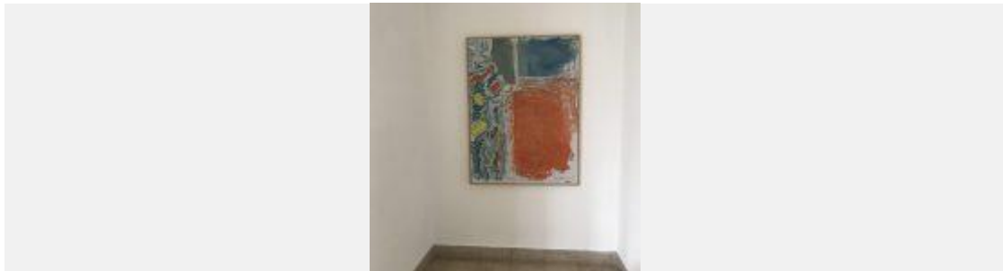
Josef Zaritzky, Painting with an Orange stain, 1972 Oil on canvas