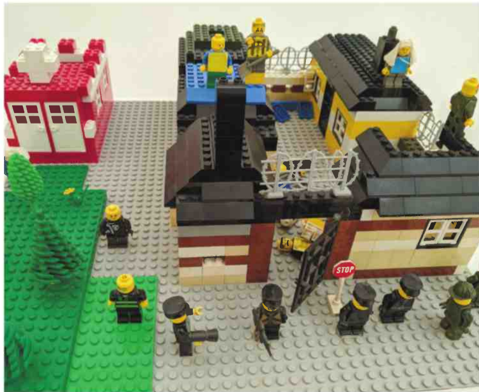
"לגו, אקציה", 2014