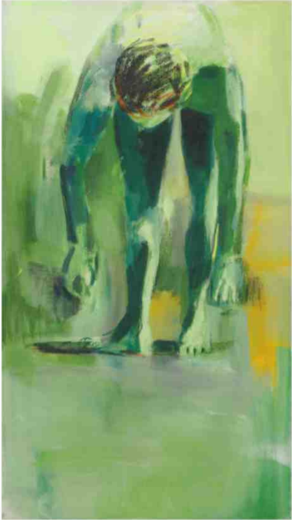
ללא יותר, 2021