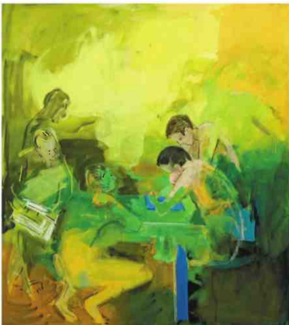
לא יותר, 2019