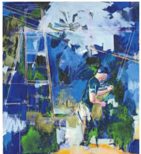
"איש עם סולם", 2020

שצירי פיוס נוצרו באותה שיטה". בדבריו הוא מתכוון לצירי דיוקנאות ריאליסטיים שצוירו על לוחות עץ או פשתן טבול בגבס, שהיו מחוברים לחזית ארוגות הקבורה שבתוכן נמצאו המומיות. האם הוא מתכנן את ציוריו, שעשויים להיראות לא גמורים? "לא. אבל אני עושה רישומים בצבע ושחור-לבן. לרוב מה שאני רושם לא מופיע באופן ישיר על הבד. הרכה מהומן בסטודיו אני מורח צבע מצד לצד. אני צריך שמשוהו יקרה כדי שהציר יתרום ואיזה רעיון יופיע. אני מנסה להשאיר את הציור פרום ככל האפשר ולא ללעוס אותו עד שהוא ייחנק. לרוב אני מצייר במידות גדולות עם מברשות גדולות."