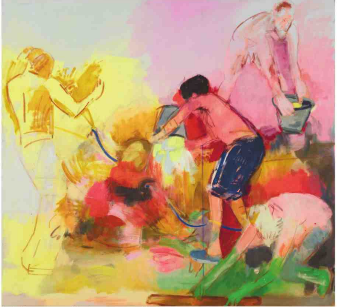
"ארבעה גברים ודליים", 2021